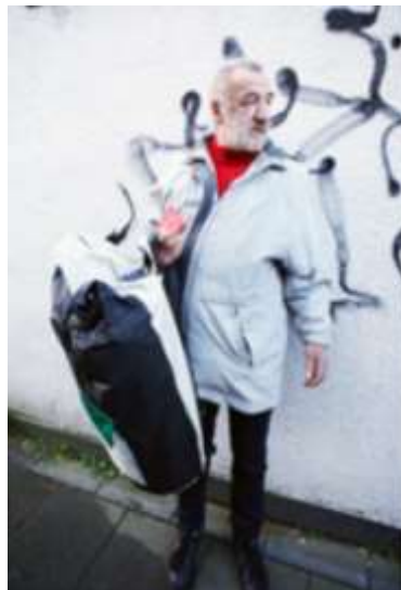
Oder verteilen von Schlafsäcken im Winter gegen den Kältetod.