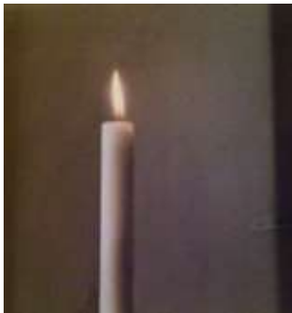
Gerhard Richter „Die Kerze“ als Symbol der Hoffnung