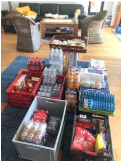
Essenspenden für Obdachlose gehören zu unseren Aktionen.

Wir begleiten hilfeschuchende Obdachlose bei Ämtergängen als ehrenamtliche Lotsen, vermitteln Wohnungen und sind aktiv bei der Wohnungssuche behilflich. Außerdem helfen wir mit Spenden bei der Wohnungsmöblierung, übernehmen Handwerkerleistungen (z.B. Herdanschluss/Spüle-Anschluss) und helfen beim Transport. 2022 haben wir für 910.000 € ein großes Haus im rechtsrheinischen Köln gekauft, in dem aktuell 7 Obdachlose menschenwürdig leben.